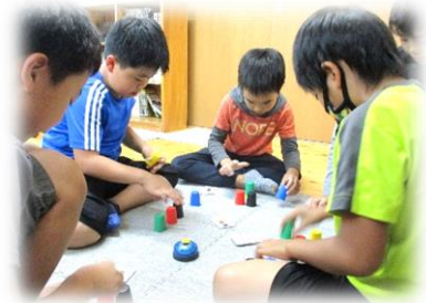
スピードカップス！並び替えが早いのは誰だ！