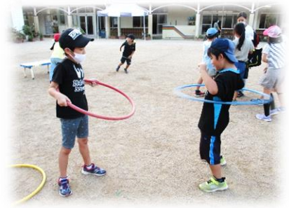
たくさん回せるかな？