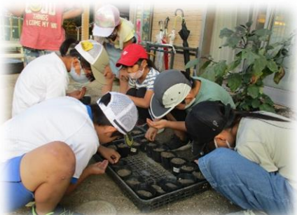
種の数数を数えながら蒔いていると…みんな真剣な表情です。