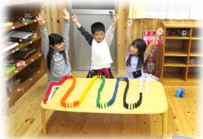
できたー！全部たおれるかな？