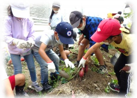
さつまいも見つけたよー。