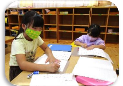
くるくるおばけができるよ。