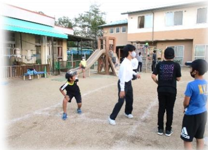
中学生のお兄さんお姉さんとリレー対決！