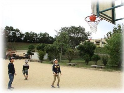
小学校で！ナイスシュート！