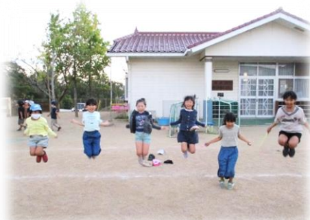
一緒にジャンプ！友だちの縄跳びを持ち合って回しているよ。