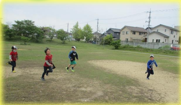
〓広いグランドで思いっきり鬼ごっこ 鬼に捕まらないように逃げろ〜

4月の参観日の振替休業日は、東4丁目グランドまで行きました。園庭ではできないあそびを広々としたグランドで楽しみました。