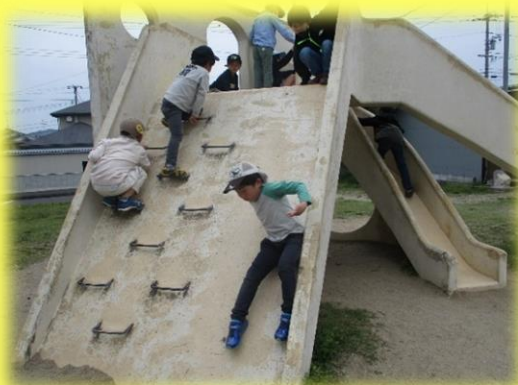
〓隣のぞうさん公園ですべり台、

〓シロツメクサやカラ スノエンドウなどの春 の草花探しも。シロツ メクサで冠作りにも挑 戦しています。