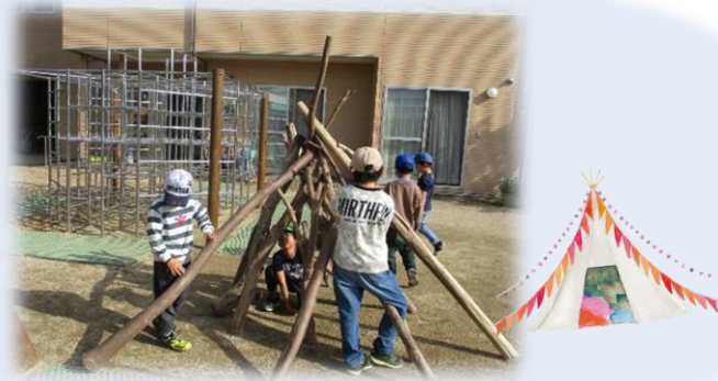
園庭の木々を使ってテントづくり。どのように組み合わせればバランスよく立つか試行錯誤しています。骨組みができれば、みどりマットをかぶせて手作りテントの出来上がり、