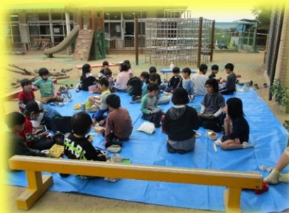
〓こどもセンターに帰ってきてからお弁当を食 べました。いつも準備をありがとうございます。