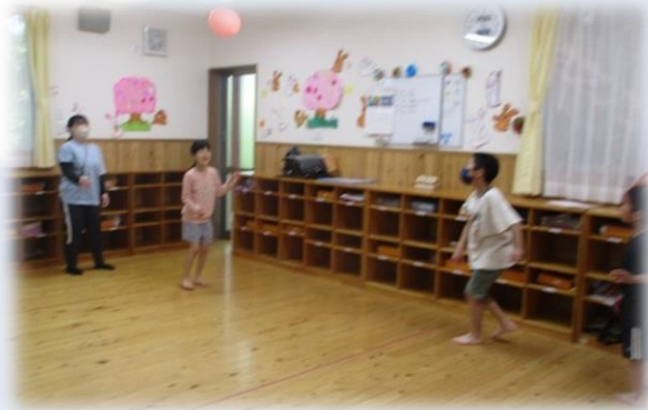
室内で風船バレー。床に風船が落ちないように相手に打ち返すよ、